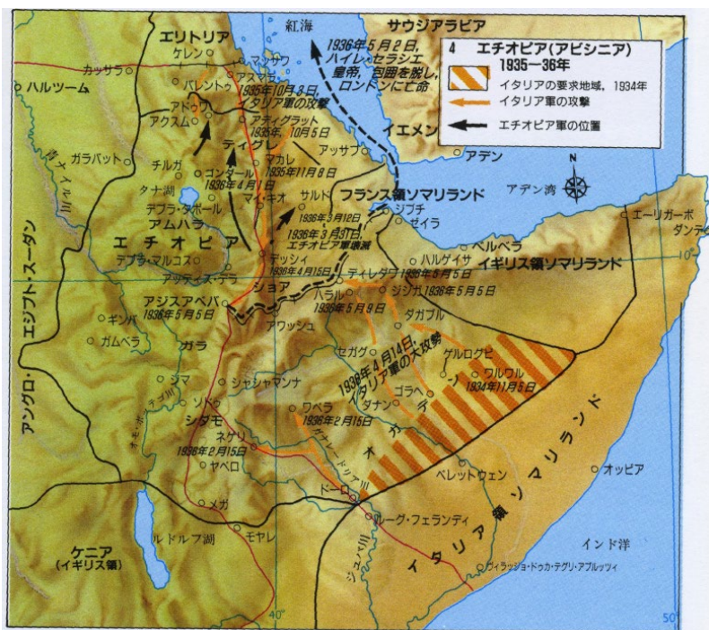
略年表 (リンク先に資料あり)